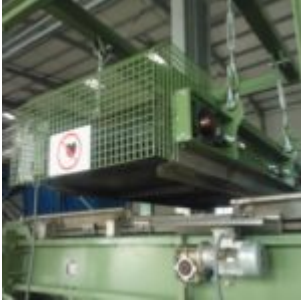
Recykling filtrów olejowych