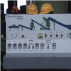
Recykling filtrów olejowych