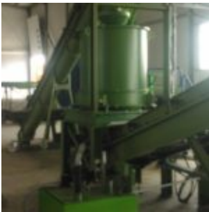
Recykling filtrów olejowych