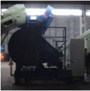
Recykling filtrów olejowych