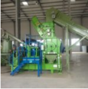
Recykling filtrów olejowych