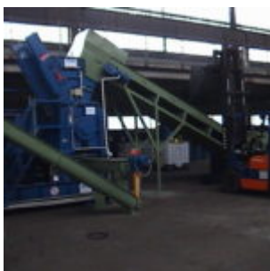
Recykling filtrów olejowych