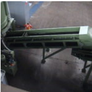
Recykling filtrów olejowych