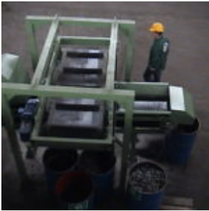
Recykling filtrów olejowych