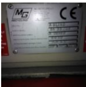
MG Compact 150T