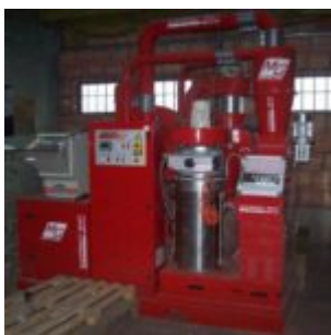
MG Compact 150T