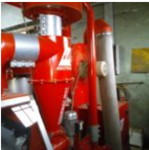
MG Compact 150T