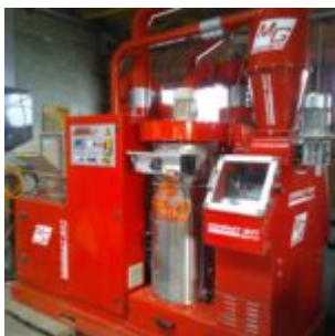
MG Compact 150T