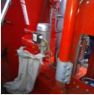
MG Compact 150T