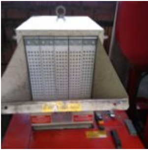
MG Compact 150T