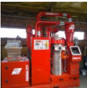
MG Compact 150T