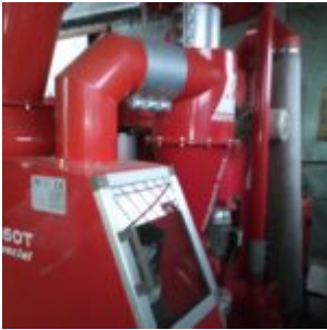
MG Compact 150T