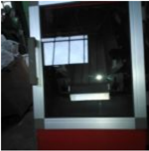
MG Compact 150T