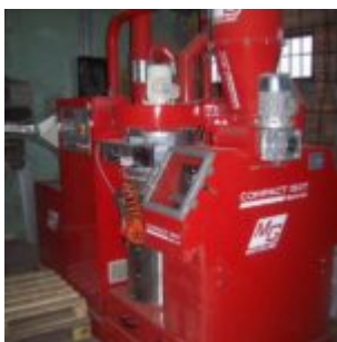
MG Compact 150T