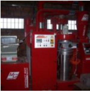
MG Compact 150T