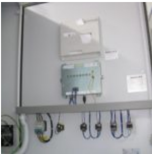
HAMOS KWS 10-10