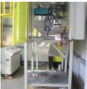
GEBRAUCHT HAMOS KWS 10-10