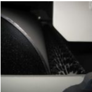
HAMOS KWS 10-10