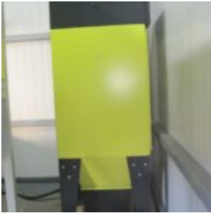
HAMOS KWS 10-10