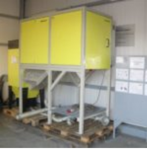
HAMOS KWS 10-10