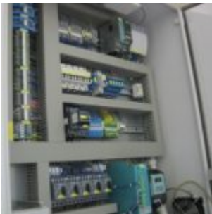
HAMOS KWS 10-10