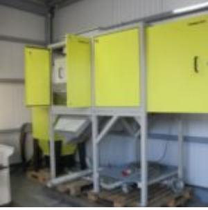
USED HAMOS KWS 10-10