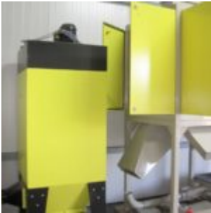
GEBRAUCHT HAMOS KWS 10-10