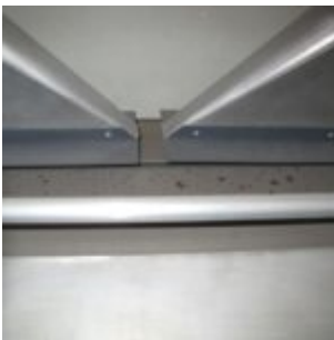
HAMOS KWS 10-10