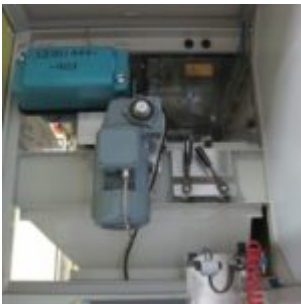
USED HAMOS KWS 10-10