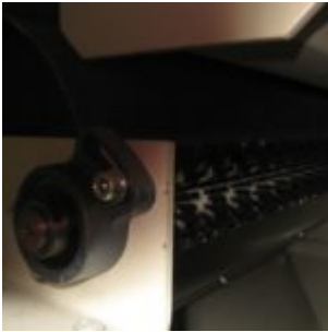
HAMOS KWS 10-10