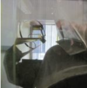
HAMOS KWS 10-10