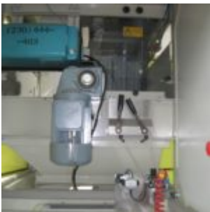
HAMOS KWS 10-10