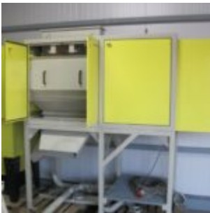
UŻYWANY HAMOS KWS 10-10