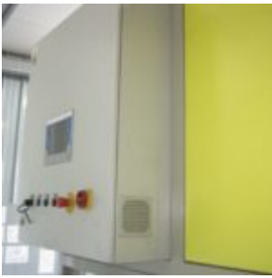
HAMOS KWS 10-10