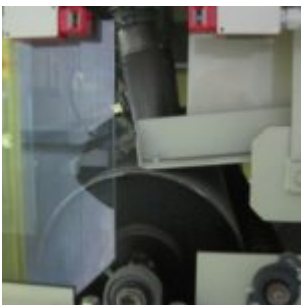
HAMOS KWS 10-10