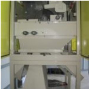
USATO HAMOS KWS 10-10