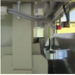
HAMOS KWS 10-10