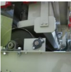
UŻYWANY SEPARATOR HAMOS KWS 10-10