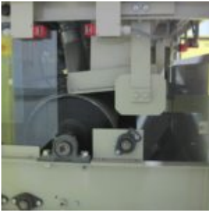
HAMOS KWS 10-10