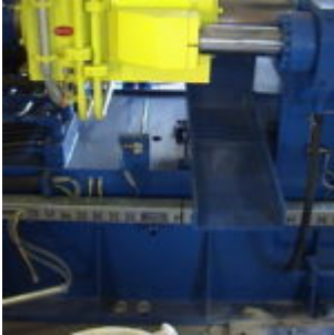
Brykociarka ATM HSB10