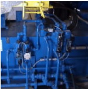
Brykociarka ATM HSB10