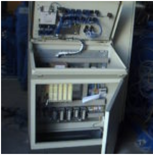
Brykiewciarka ATM HSB10