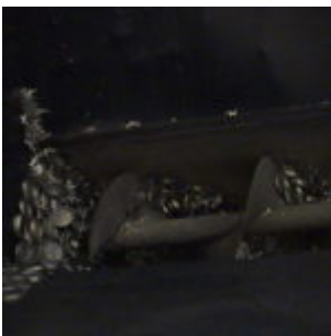
Brykiewciarka ATM HSB10