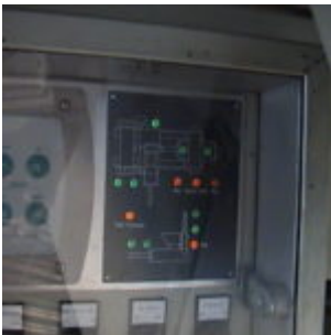
Brykiewciarka ATM HSB10