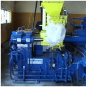
Brykociarka ATM HSB10