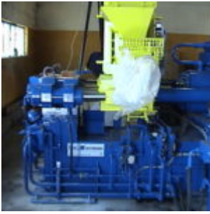
Brykociarka ATM HSB10