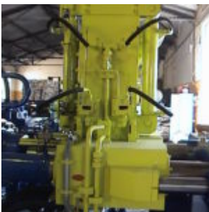
Brykociarka ATM HSB10