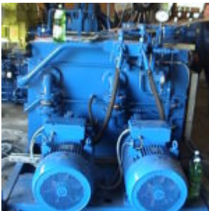
Brykociarka ATM HSB10