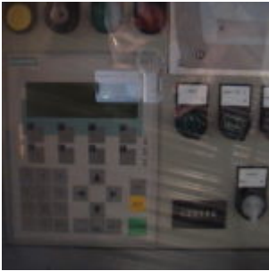
Brykiewciarka ATM HSB10