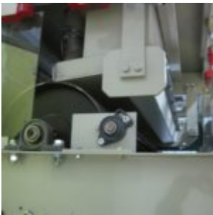
UŻYWANY SEPARATOR HAMOS KWS 10-10