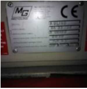
MG Compact 150T