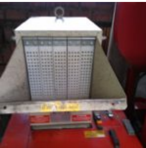
MG Compact 150T