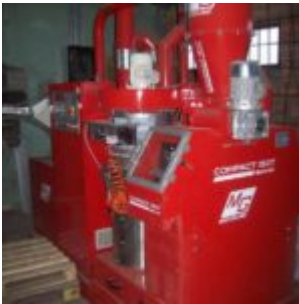
MG Compact 150T