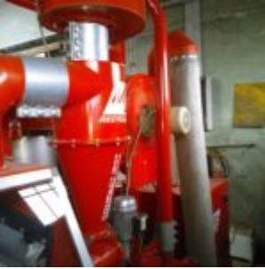
MG Compact 150T