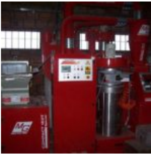
MG Compact 150T