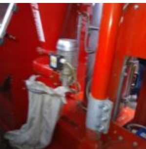
MG Compact 150T