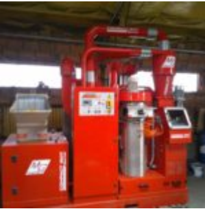
MG Compact 150T