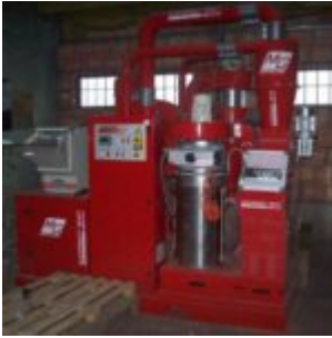
MG Compact 150T