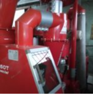
MG Compact 150T