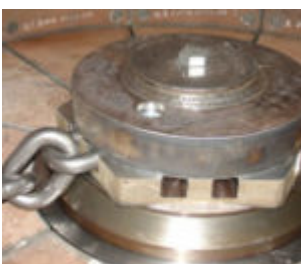
Querstrommzerspaner TQZ 2500