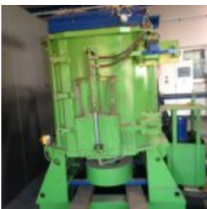
Querstrommzersanner MeWa QZ 1200